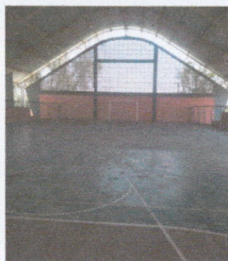
- Quadra Poliesportiva "Keiichi Tsuchida"