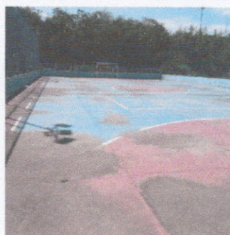
- Quadra Poliesportiva "Chitoshi Koga"