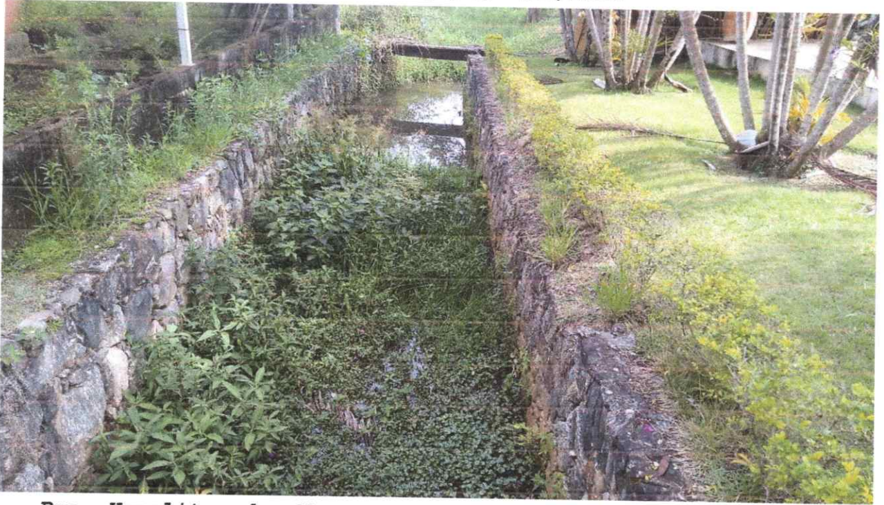
- Rua Hypolita de Moraes Magalhães, altura do nº 740, Loteamento Parque Agrinco.