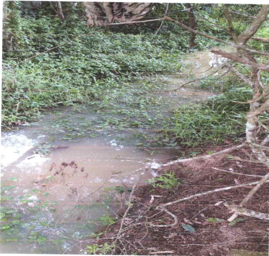
- Rua Padre Leo Beckman, altura do nº 500, Loteamento Parque Agrinco.