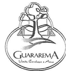
TABELA X - REGRAS DE TRIBUTAÇÃO DO MUNICÍPIO DE GUARAREMA